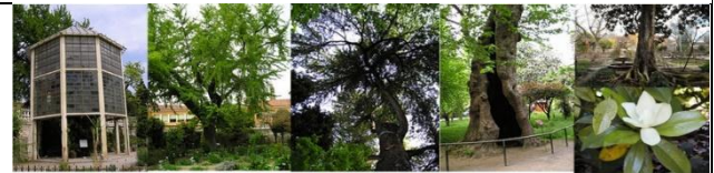
Palma di Goethe Ginkgo Cedro dell'Himalaya Platano orientale Magnolia